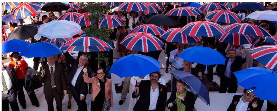
Inauguración de la nueva sede del British Council en Madrid - Octubre 2014

Puede consultar el informe completo a través de este código QR