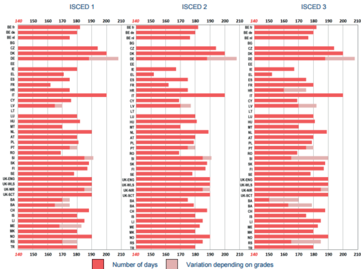
Figura 3: Número de días lectivos 2016/2017

En esta tabla se puede consultar el número de días lectivos en cada país por nivel educativo.