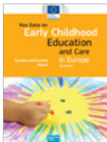
Cifras clave en Educación y Atención a la Primera infancia. Edición 2014.

La calidad de la educación y la atención en la primera infancia depende en gran medida de buenas prácticas de enseñanza y aprendizaje, así que las orientaciones didácticas son imprescindibles. Sin embargo, en casi la mitad de los países incluidos en el estudio (BEnl, BEde, BG, CZ, CY, FR, IT, LU, AT, PL, PT, SK, UK - Gales e Irlanda del Norte), LI y CH solo existen orientaciones de esta índole en la oferta para niños a partir de tres años de edad. En el caso de los niños menores de tres años el énfasis se pone en la atención y el cuidado, no en estimular el progreso en el aprendizaje.