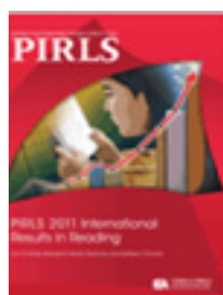
PIRLS 2011 International Results in Reading.