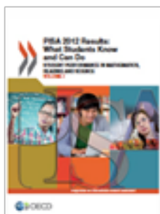
PISA 2012 Results: What Students Know and Can Do. Student Performance in Mathematics, Reading and Science. Volume I