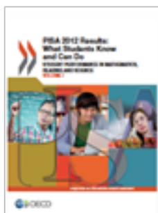
PISA 2012 Results: What Students Know and Can Do. Student Performance in Mathematics, Reading and Science. Volume I